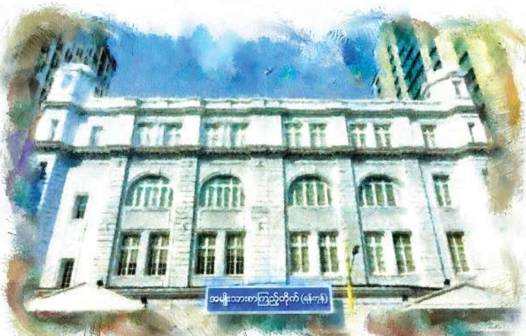
အမျိုးသားစာကြည့်တိုက် (ဧရာဝတီ)

မွန်းတည့် (၁၂) နာရီထိုးပြီ။ မြန်မာအသံက တီးလုံးလာ နေလေပြီ။ အချိန်မတွက်ဆမိသည်က ကျွန်တော် အများ။ ထမင်းစား လောဘက အတော်ဆိုး၏။ ထမင်းစားပြီး ရေနှေးကြမ်းသောက်သော လောဘကလည်း ကြီးပါ။ ရေနှေးကြမ်း တစ်မတ်ခွက် မမော့လိုက်ရလျှင်ကို တစ်ခုခု လိုနေသလို။ ရေနှေးကြမ်း အမော့ကောင်းလို့ ရုံးနောက်ကျတော့မည်။ အဆောင်တည်ရာ လမ်း ၄၀ ကနေ ရုံးတည်နေရာ ၃၇ လမ်းမှာ ၄ လမ်းသာကွာဝေး။ နို့ဖို့ ဒုန်းစိုင်းပြေးလည်း မမိ။ ခုတော့ အပြေးအသော့ ကိုယ်ဖော့ခြေလှမ်းများဖြင့် လှမ်းလိုက်ရာ ၁၂ နာရီ ၅ မိနစ် စွန်းစွန်းတွင် ကျွန်တော်တို့၏ မြို့လယ်ကောင်ရီ ပြည်သူ့စာကြည့်တိုက်ကြီး၏ တံခါးပေါက်သို့ ဆိုက်ရောက်လေသည်။